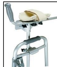
SUPPORT AVANT-BRAS ITEM# 8000